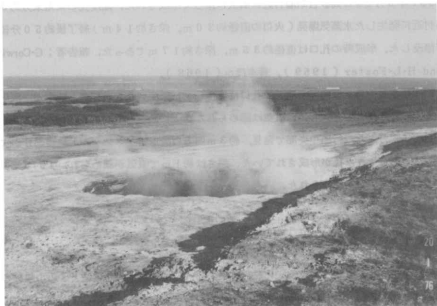
写真2 阿蘇台陥没孔（図1のC）