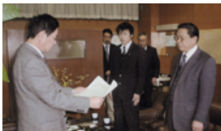
感謝状授与の様様

愛称は「Eディフェンス」と決定しました。これは災害から市民生活や財産を守ること、災害を未然に防御する意