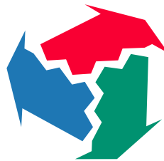
Eディフェンスのマーク