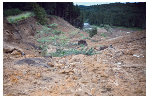
写真1 斜面上方から見た白河市葉ノ木平地すべり