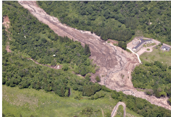
写真3 栄村中尾川の地すべりから流下した土砂

した。御斎所変成岩から成る急斜面で生じた高速地すべりで、直下の住宅にまで到達し、3名の犠牲者を出しました(写真4)。