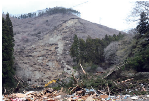
写真4 いわき市石住の地すべりと倒壊した家屋