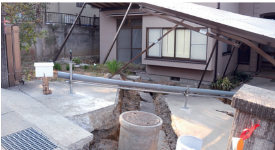
写真2 仙台市緑ヶ丘の住宅地内の地すべり亀裂

今回の地震では仙台市、白石市、いわき市を始め各地の住宅地において盛土地盤が地すべりを起こす災害が生じています。我々が調査を行なった仙台市太白区緑ヶ丘の住宅造成地は1978年宮城県沖地震の際も地すべり変動が起きたところで、今回の地震でも再度地すべりが起き、写真2に示すように変動範囲の住宅では大きく開いた亀裂によって家が斜面下方に1mほど滑り落ちています。こういった住宅地の盛土地盤の被害は、最近の地震でしばしば生じており、盛土地盤の今後の対策が求められています。