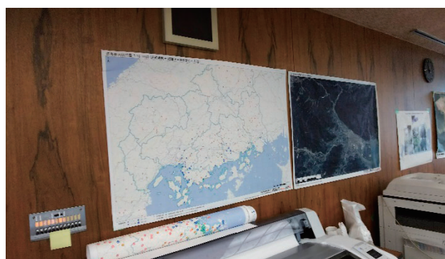
図 3 紙地図による情報共有の事例 Fig. 3 Example of information sharing by paper map.

していたが、地図作成依頼書による記録対応を 7 月 15 日より開始したため、表 2 では 7 月 15 日以降の提供地図の記録を示している。