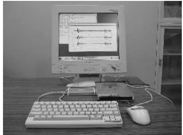
図2 今回導入したシステムの全景 Fig. 2 Overview of the barebone PC system.

ソフトウェアを含めた同一の計算機環境を実現するには、あらかじめOSがインストールされ、プログラムの動作確認が済んだPCをそのまま利用すれば良い。しかしながら、主に使用されているデスクトップ型のPCは、サイズが大きく重量もあるため持ち運びに不便である。筆者の一人である山品がインドネシアにおける広帯域地