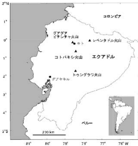
図1 エクアドルの主要な活動的火山 Fig. 1 Major active volcanoes in Ecuador.

は、双方の環境の違いが問題の1つになる。これまでに開発されてきた地震学や火山学における解析に利用されているプログラムはUNIX系のOSで動作するものが多い。UNIX系OSの動作するワークステーションは最近まで大変高価であったことから、開発途上国ではその導入が困難であった。しかしながら、近年はLinuxやFreeBSDといったパーソナルコンピュータ(PC)上で動作するUNIX系OSが開発され、比較的安価にUNIX環境を整備することが可能となっている。Rivera氏との研修においても、PC+Linuxを用いたコンピュータ環境を利用した。これは、研修に用いたプログラムやデータを持ち帰ってもらえば、同様の環境を自国で構築できると考えたためである。しかしながら、熊谷がJICA研修のフォローアップとして初めてエクアドルを訪問した時には、UNIX系OSが導入されていたコンピュータは1台も存在しておらず、Rivera氏が日本での研修終了後に持ち帰ったデータやプログラムは利用できない状況であった(熊谷・林, 2002)。そこでその訪問中に、研究所にあったPCへLinuxをインストールすることにより、プログラムなどを利用可能にした。しかしながら、このような現地におけるインストレーションを短い滞在期間に行うことは大変非効率である上、コンパイラの違いなどからプログラムが正常に動作しない危険性を伴う。